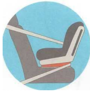
Лицом против движения