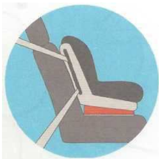
Лицом по ходу движения

Самое безопасное место для установки детского кресла в автомобиле — среднее место на заднем сиденье. Самое небезопасное - переднее пассажирское сиденье. Туда автокресло ставится в крайнем случае, при обязательно отключенной подушке безопасности.